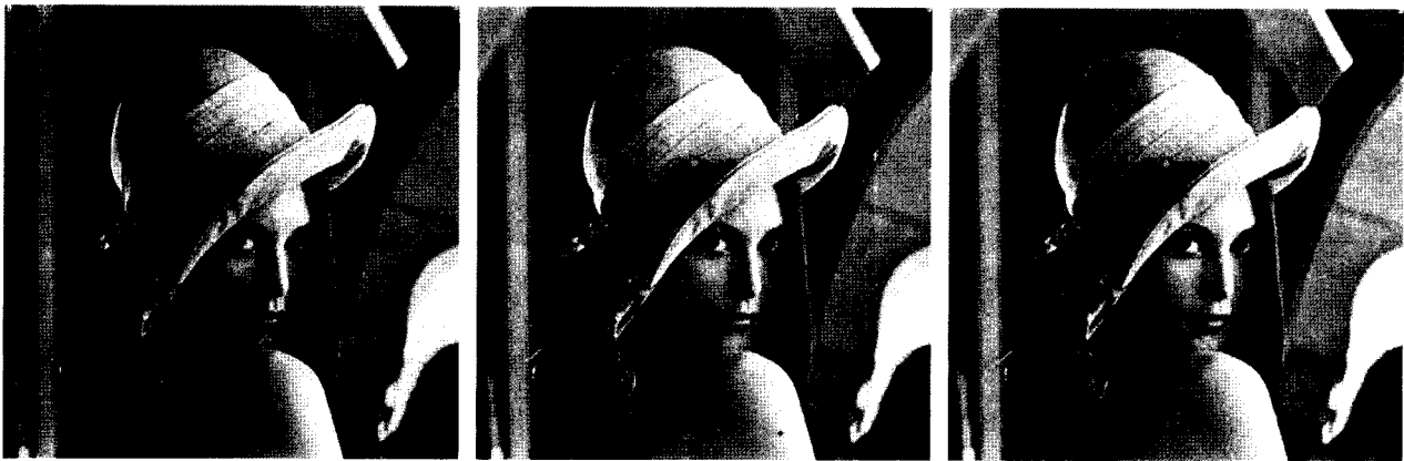
(a) Lene 원 영상 (a) Original Lena image (b) 제안된 방법으로 축소 후 확대된 영상 (b) Reconstructed image after halving and doubling by the proposed method (c) 제안된 방법에 의해 축소된 영상 (c) Halved image by the proposed method